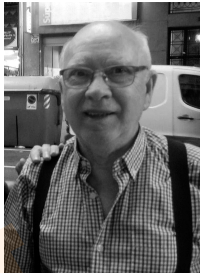
Gracias por enseñarme tanto. Que las aguas del río Tera, donde pasaste tu niñez y donde descansa tu padre, sepan arrojarte como lo haríamos quienes aún te queremos y tenemos presente.